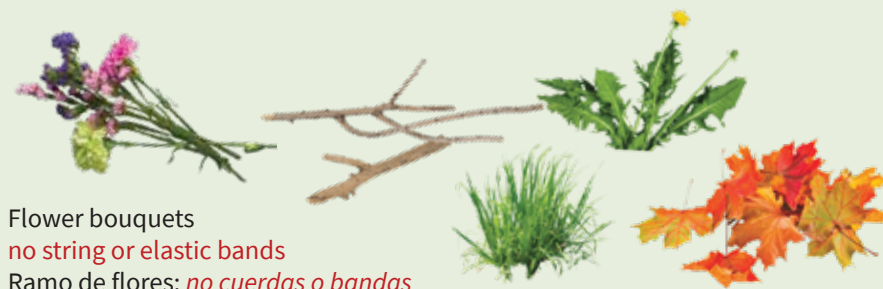
Flower bouquets no string or elastic bands Ramo de flores: no cuerdas o bandas

Customers may continue to use brown paper lawn bags to contain yard waste OUTSIDE THE CART.*